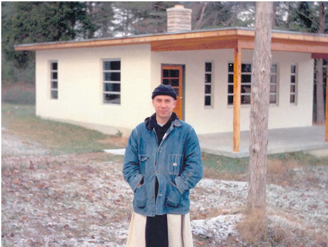
Thomas Merton voor de kluis in de kloostertuin van Gethsemani. De trappist is een van de invloedrijkste katholieke schrijvers van de twintigste eeuw.

Thomas Merton was dan wel kloosterling, maar hij hoorde tegelijkertijd bij de wereld, legt hij uit in Bespiegelingen van een schuldige toeschouwer .