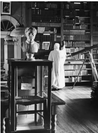
Thomas Mertons, 1914 - 1968.

Interview | Monnik Thomas Merton, honderd jaar geleden geboren, was met spiritualiteit bezig lang voordat die mode werd. En het ging hem niet om 'je goed voelen', maar om het doorgronden van de existentiële ervaring waarop religie rust.